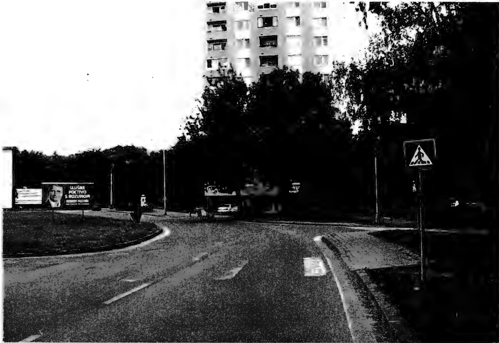
POHĽAD KU KAUF LANDU